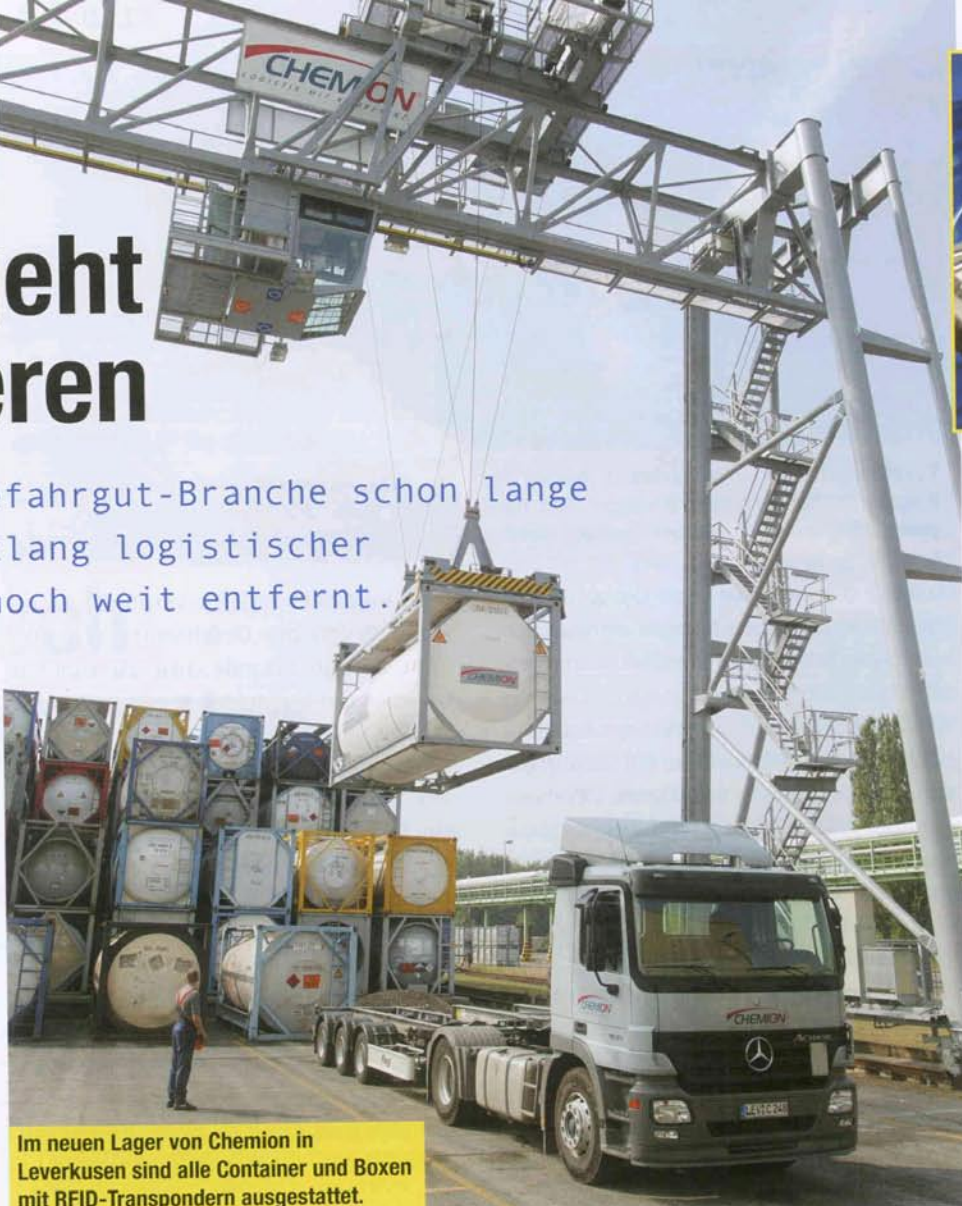
Im neuen Lager von Chemion in Leverkusen sind alle Container und Boxen mit RFID-Transpondern ausgestattet.